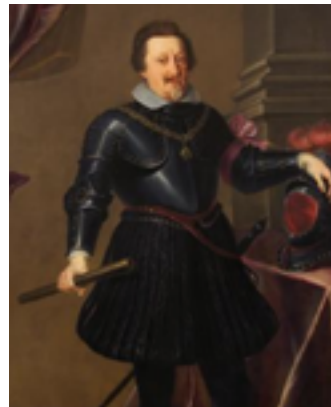
Ferdinand II. 5

Od roku 1555 (Augšpurský mír) platilo v habsburské monarchii pravidlo, že panovník může rozhodnout o náboženství na území, kde vládne. Obyvatelstvo se tedy muselo uložené konfesi přizpůsobit nebo zemi opustit. Když se Ferdinand II. stal 1617/18 králem v Čechách, využil tohoto práva a chtěl v Čechách prosadit katolickou víru, třebaže byla v Čechách silně zastoupena víra protestantská. Nedělo se to v míru, ale částečně pod velkým tlakem. To si ale česká evangelická šlechta nechtěla nechat líbit, protože nechtěla ztratit vliv na politiku v zemi a chtěla žít podle své víry. Proto došlo po nějakém čase k pražské defenestraci. Ta představovala počátek povstání českých protestantských stavů proti katolickým Habsburkům.