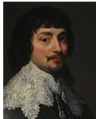
Ferdinand II. 7

Boje vyvrcholily v bitvě na Bílé hoře (1620), v níž vyhráli katolíci. Osoby odpovědné za české povstání byly popraveny nebo vypovězeny ze země, jejich majetek byl zabaven. Ferdinand II. vydal 1627/28 Obnovené zřízení zemské, v němž je zakotveno dědičné právo na český trůn. Tím ztratily Čechy svou politickou samostatnost a také protestantská víra byla zakázána. Tisíce (zejména bohatších) rodin Čechy opustily, protože se nechtěly poddat katolické nadvládě.